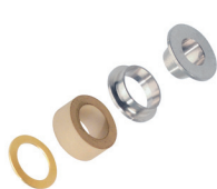
Съемное уплотнение тип Z