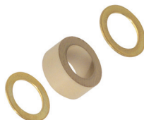
Съемное уплотнение тип W